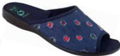
84 art. 24967 GR/CZ