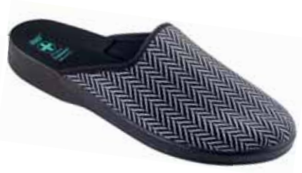
243 art. 25147 CZ/CZ