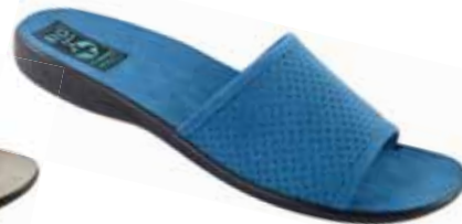
78 art. 24826 GRJ/CZ