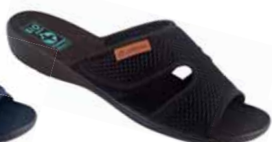
45 art. 24798 CZ/CZ