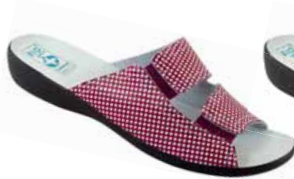
26 art. 24915 BO/CZ