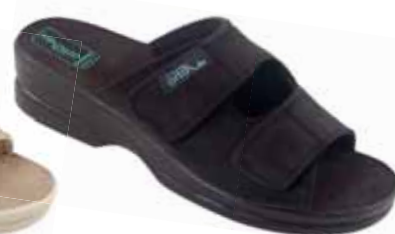
4 art. 26185 CZ/CZ