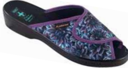
208 art. 24663 MO/CZ