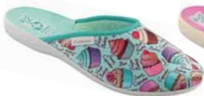
104 art. 25902 KOL/SZJ