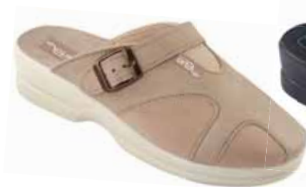
8 art. 25126 BZ/BZ