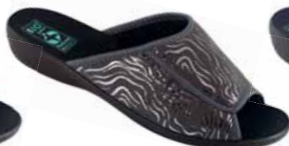
49 art. 25917 SZ/CZ