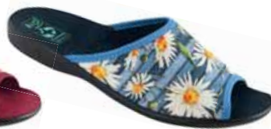
91 art. 25937 NI/CZ