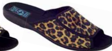
98 art. 13794 BZ/CZ