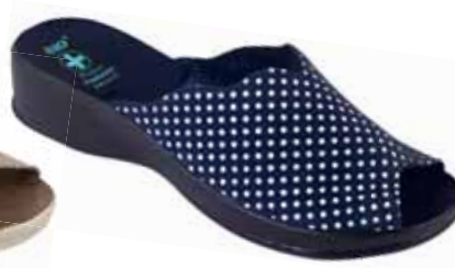
141 art. 22967 GR/CZ