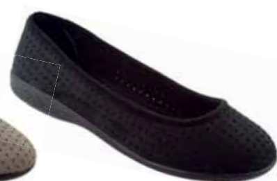
115 art. 16638 CZ/CZ