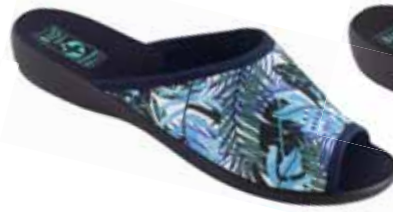
53 art. 25906 N/CZ