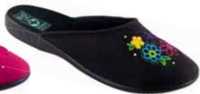
109 art. 24713 CZ/CZ