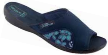
15 art. 24879 GRTU/CZ