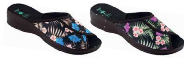
151 art. 24698 NI/CZ