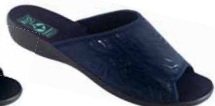
50 art. 25919 GR/CZ