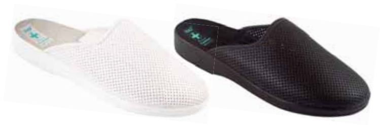
249 art. 24885 BI/BI.L