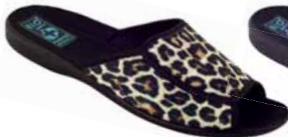
97 art. 13795 BI/CZ