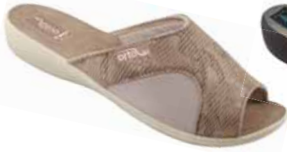
13 art. 26180 BZ/BZ