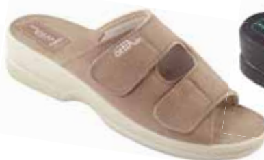
3 art. 26184 BZ/BZ