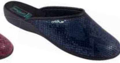
17 art. 25529 GR/CZ