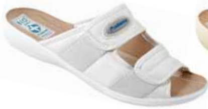
18 art. 17659 BI/BI.L