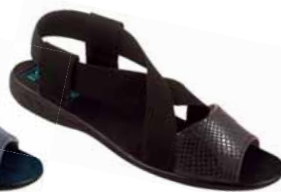
133 art. 24608 CZ/CZ