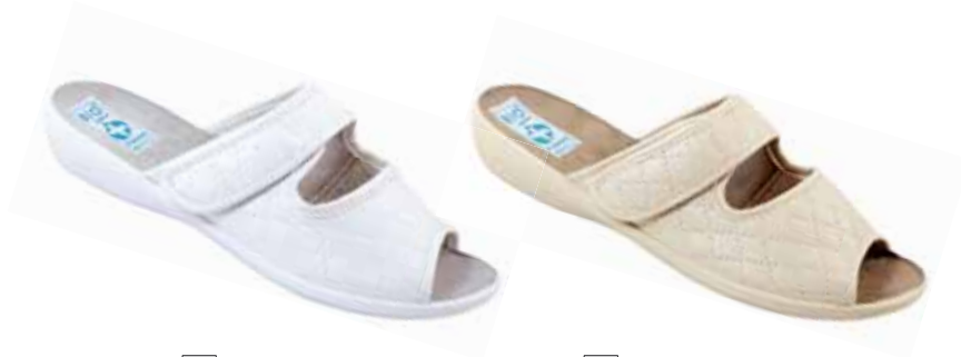
23 art. 18772 BI/BIŁ