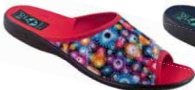
92 art. 24755 KOL/CZ