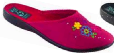
108 art. 24715 MA/CZ