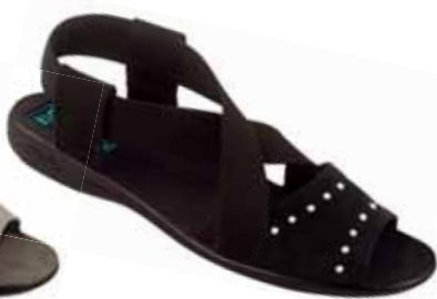
131 art. 24789 CZ/CZ