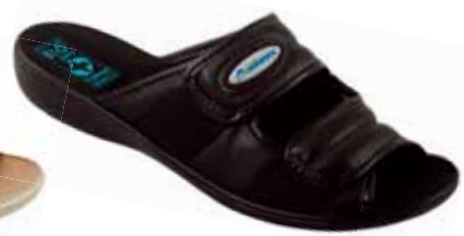
20 art. 17661 CZ/CZ