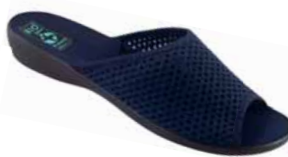
62 art. 24717 GR/CZ