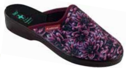
214 art. 24666 BU/CZ