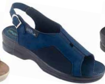
11 art. 26190 GR/CZ