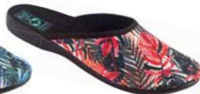
107 art. 25909 CW/CZ