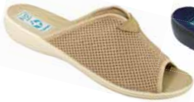
40 art. 20026 BZ/BZ