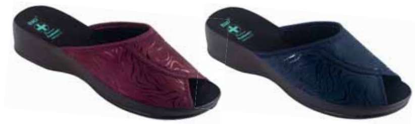
146 art. 25915 BU/CZ