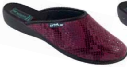
16 art. 25530 BO/CZ