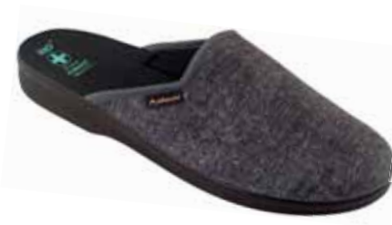
241 art. 24617 SZC/CZ