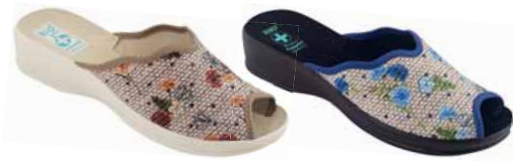
142 art. 25977 BZ/BZ