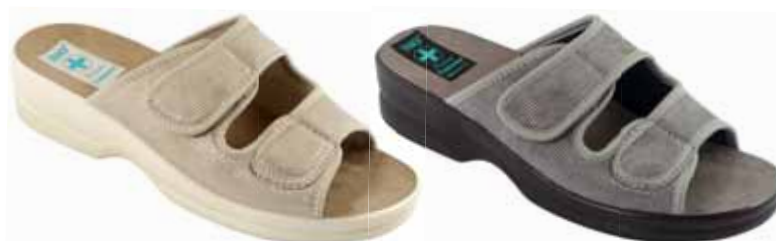
185 art. 26002 BZ/BZ