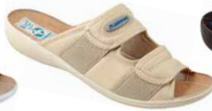
19 art. 17660 BZ/BZ