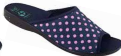
85 art. 24961 GRRO/CZ