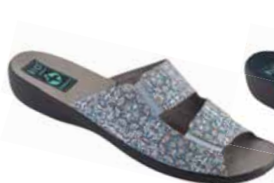
34 art. 25944 SZ/CZ