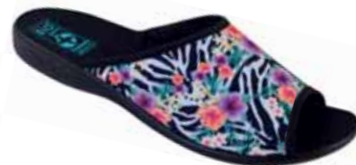
95 art. 23876 RC/CZ