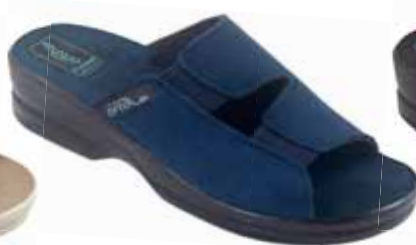
6 art. 26187 GR/CZ