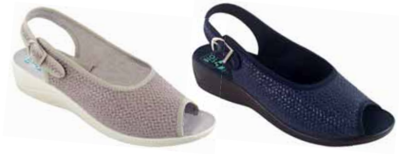
180 art. 26045 BZ/BZ