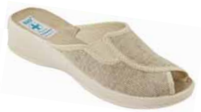
145 art. 16466 BZ/BZ