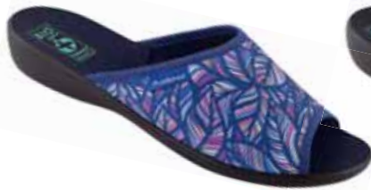
55 art. 24615 N/CZ