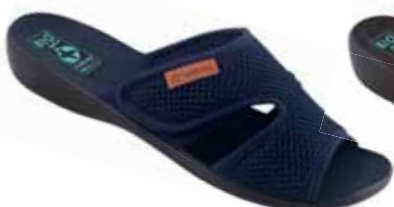
44 art. 24797 GR/CZ