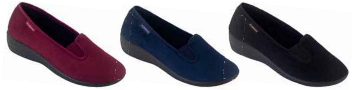
177 art. 25830 B0/CZ