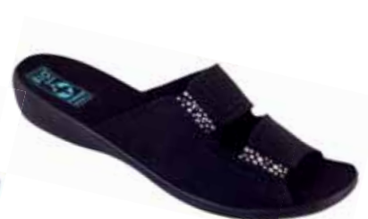
31 art. 23892 CZ/CZ