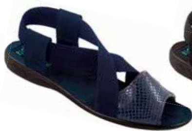
132 art. 24610 GR/CZ