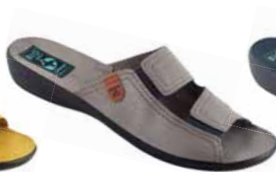
29 art. 26026 SZ/CZ