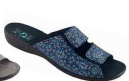
35 art. 25943 GR/CZ