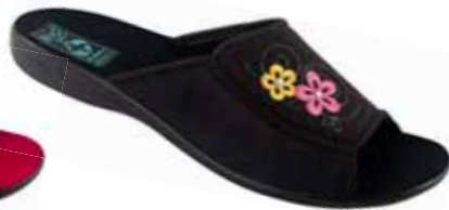
103 art. 24628 CZ/CZ