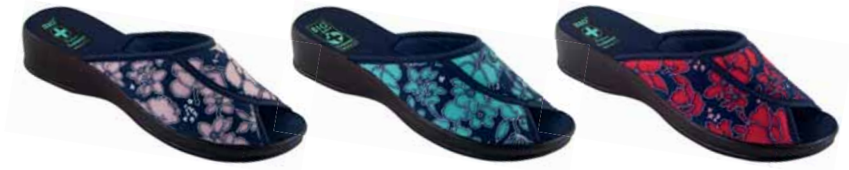
148 art. 24895 RJ/CZ