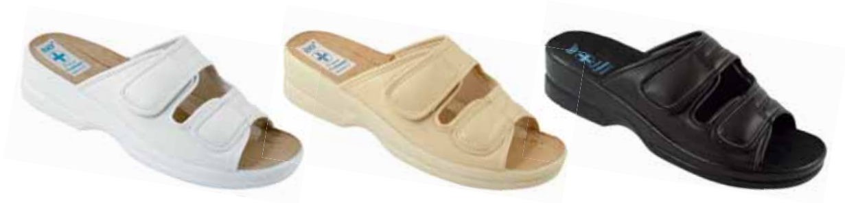
182 art. 16545 B1/B1L