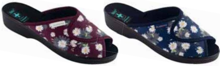
203 art. 25911 BU/CZ