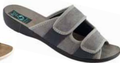
22 art. 26005 SZ/CZ