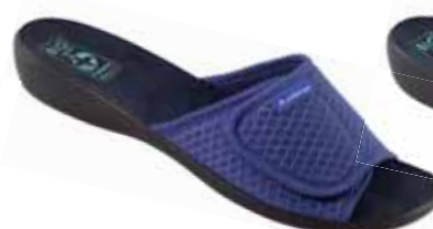
46 art. 24842 NI/CZ