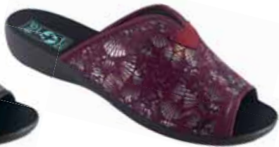
37 art. 25920 BU/CZ