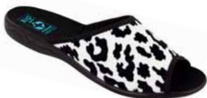
96 art. 24957 BIC/CZ