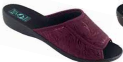
48 art. 25918 BU/CZ