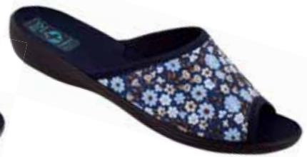
60 art. 18760 GR/CZ