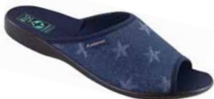
83 art. 24671 GR/CZ