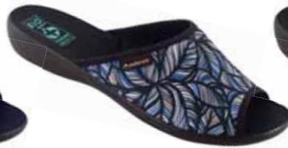
56 art. 24614 GR/CZ