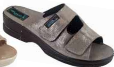
2 art. 26183 SZ/CZ