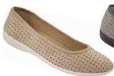
113 art. 16425 BZ/BZ