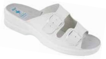
245 art. 3820 BI/BI.L