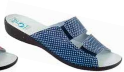
27 art. 24917 GR/CZ