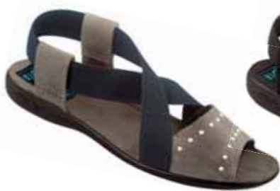
130 art. 24787 SZ/CZ