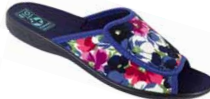
101 art. 23000 GR/CZ