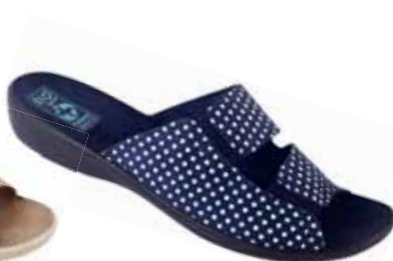
33 art. 23051 GR/CZ