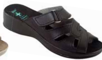
139 art. 24861 CZ/CZ