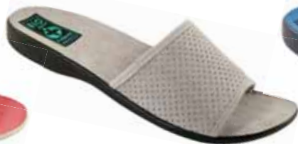
77 art. 24825 SZ/CZ