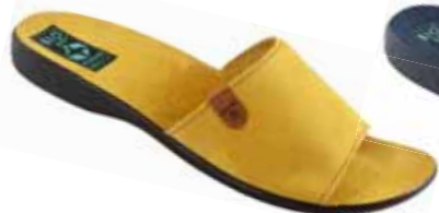
79 art. 26010 MIO/CZ