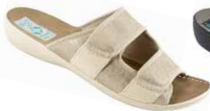
21 art. 26004 BZ/BZ