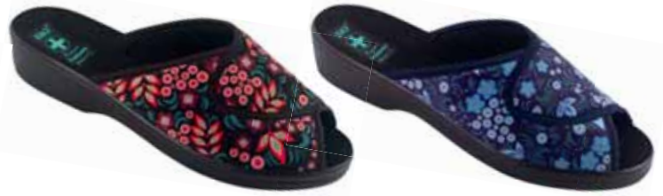
205 art. 26070 CW/CZ