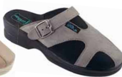
9 art. 25125 SZCZ/CZ