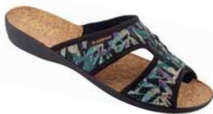
61 art. 24737 CZ/CZ