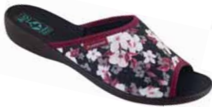
58 art. 24704 BO/CZ