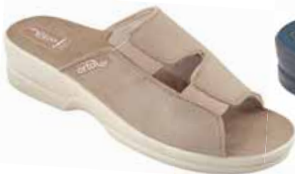
5 art. 26186 BZ/BZ