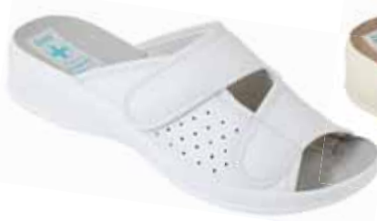
135 art. 22871 BI/BI.L