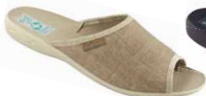
86 art. 25970 BZ/BZ