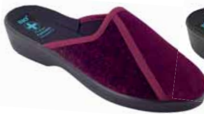
212 art. 197 BO/CZ