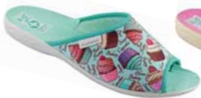
88 art. 25904 KOL/SZJ