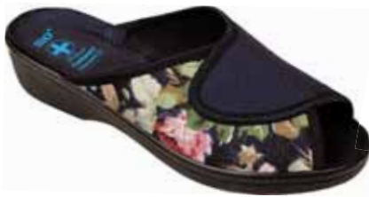
207 art. 5775 GR/CZ