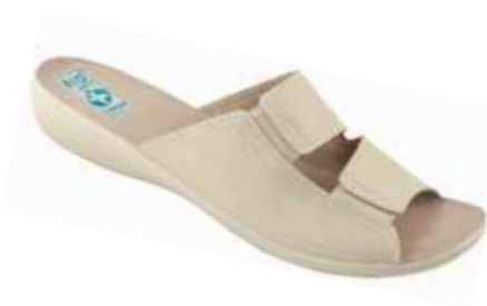
25 art. 24905 BZI/BZ