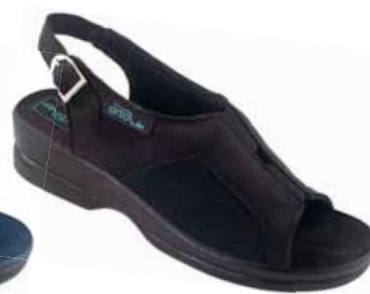
12 art. 26191 CZ/CZ