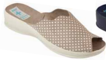
140 art. 22972 BZ/BZ