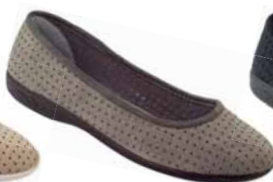
114 art. 16426 SZ/CZ