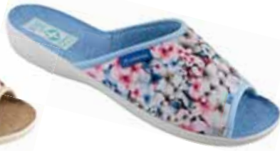
52 art. 25899 N/SZJ