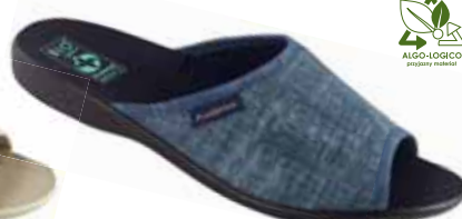
87 art. 25969 GR/CZ