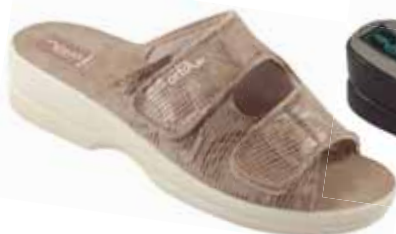
1 art. 26182 BZ/BZ