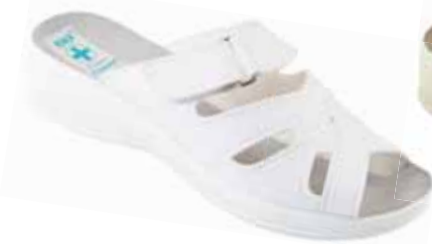
137 art. 24863 BI/BI.L