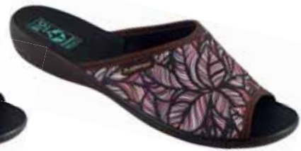
57 art. 24616 BR/CZ