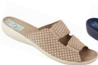
32 art. 22862 BZ/BZ