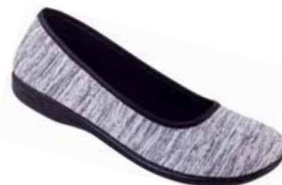
112 art. 23897 SZ/CZ