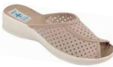
144 art. 21582 BZ/BZ