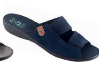
30 art. 26027 GR/CZ