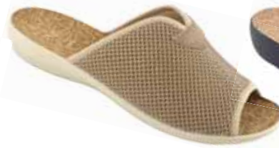
42 art. 26009 BZC/BZ