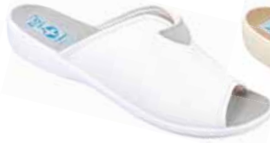
38 art. 20210 BI/BI.L