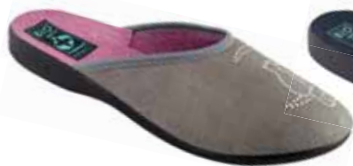
110 art. 25677 SZ/CZ