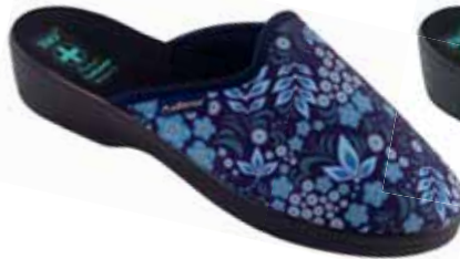
210 art. 26073 NI/CZ