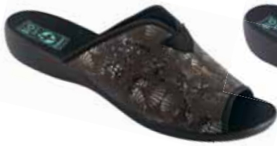
36 art. 25921 SZ/CZ