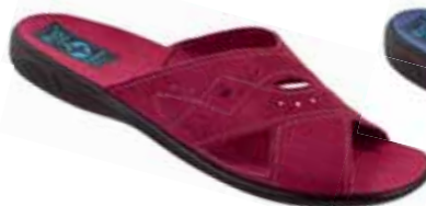
81 art. 18796 BO/CZ