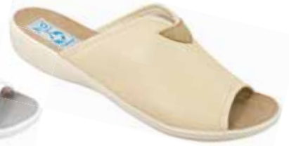
39 art. 20028 BZ/BZ