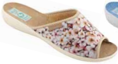
51 art. 25898 BZC/BZ