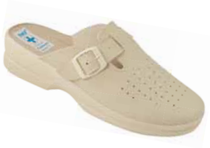
248 art. 3807 BZ/BZ