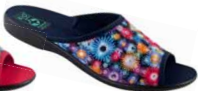
93 art. 24641 KOL/CZ