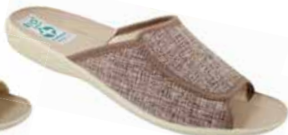
100 art. 17449 BZC/BZ