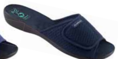
47 art. 24843 GR/CZ