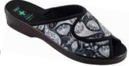
209 art. 24653 SZ/CZ