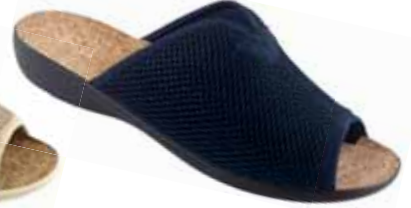
43 art. 26008 GR/CZ