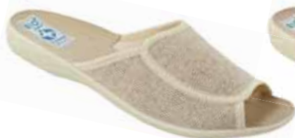
99 art. 16670 BZ/BZ