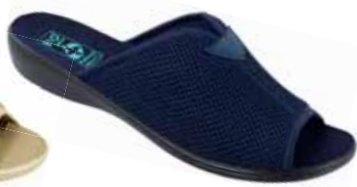
41 art. 20024 GR/CZ