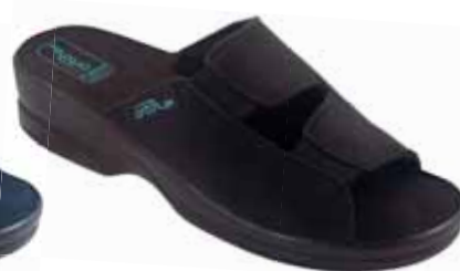
7 art. 26188 CZ/CZ