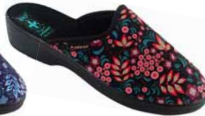
211 art. 26072 CW/CZ