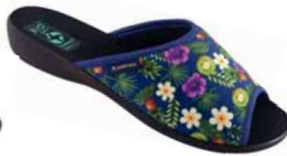
59 art. 26061 ZV/CZ