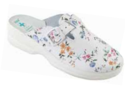
246 art. 24930 BI/BI.L