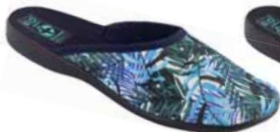
106 art. 25908 NI/CZ