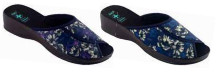
153 art. 26067 RO/CZ