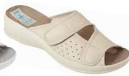
136 art. 22870 BZ/BZ