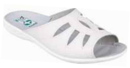
244 art. 9241 BI/BI.L