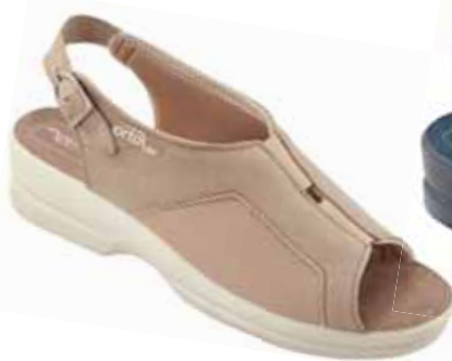
10 art. 26189 BZ/BZ