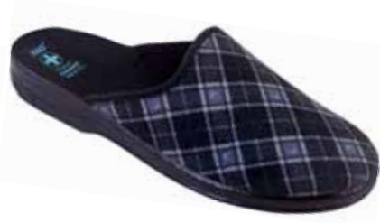
242 art. 23968 CZ/CZ