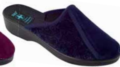
213 art. 206 GR/CZ