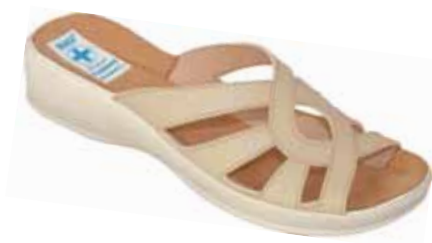
134 art. 11441 BZ/BZ