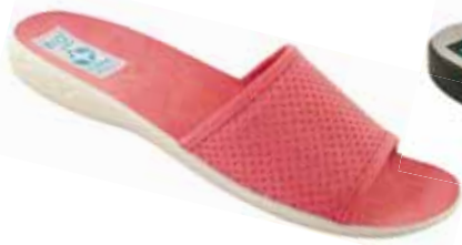
76 art. 24827 RJ/BZ