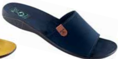
80 art. 26011 GR/CZ