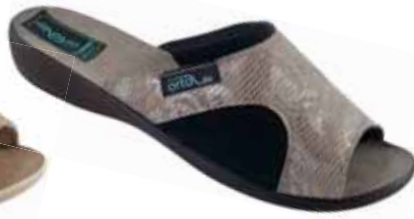
14 art. 26181 SZ/CZ