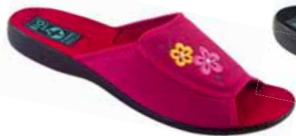
102 art. 24625 MA/CZ