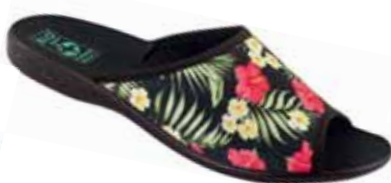
94 art. 24696 CW/CZ