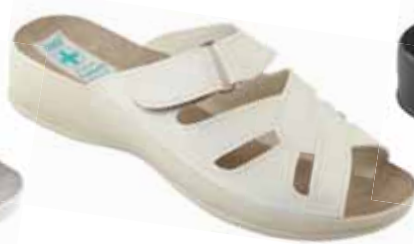
138 art. 24862 BZ/BZ