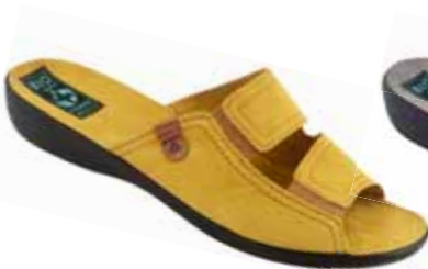
28 art. 26013 MIO/CZ