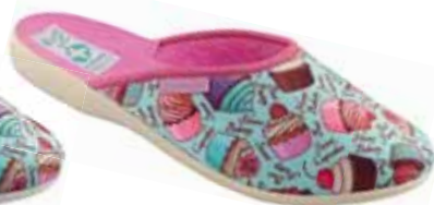
105 art. 25903 KOL/BZ