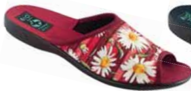
90 art. 25938 CW/CZ