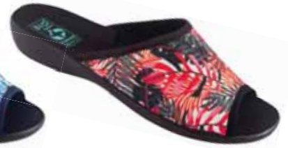
54 art. 25907 CW/CZ