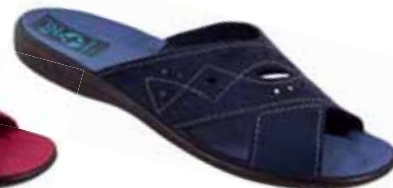
82 art. 18798 GR/CZ