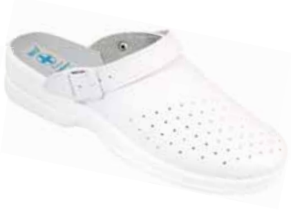
247 art. 3822 BI/BI.L