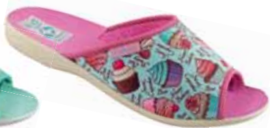
89 art. 25905 KOL/BZ