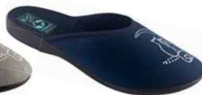
111 art. 25675 GR/CZ